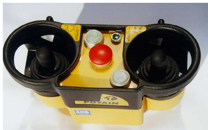
SENDER: Steuergehäuse Typ PRC1 - PRC2