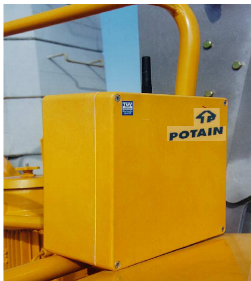
HD-EMPFÄNGER: am Kran angebracht