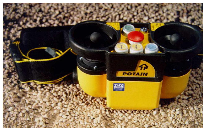
SENDER: Steuergehäuse Typ PRC3